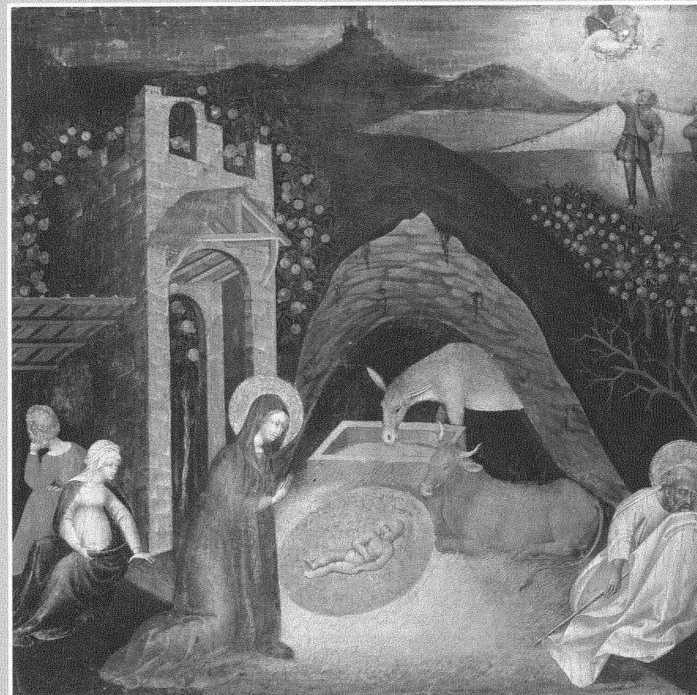
Giovanni di Paolo (1398–1482), Geburt Christi Pinacoteca Vaticana, Musei Vaticani

Gott ist Mensch geworden, damit wir Sternstunden erleben, wenn es eben noch Nacht war.