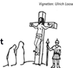
Karfreitag: Das Leben hingeben.