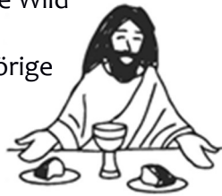
Gründonnerstag: Das Leben teilen.